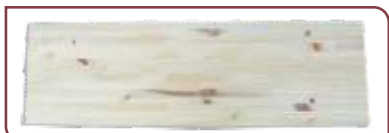
ESCALON Pino Línea Natural . 30 x 270 x 750/950 mm