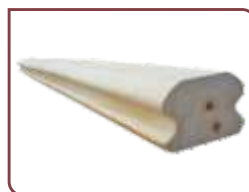
Pino Línea Natural 42 x 65 mm