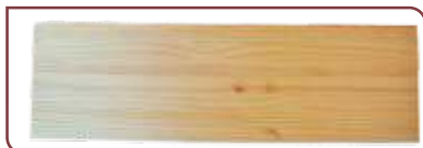
ESCALON Pino Clear . 30 x 270 x 750/950 mm