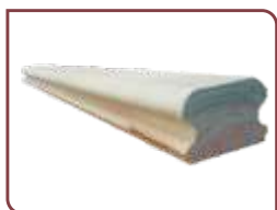
Euca Clear 42 x 65 mm