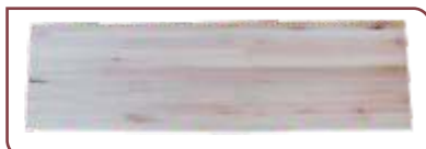
ESCALON . Euca Línea Natural . 30 x 270 x 750/950 mm