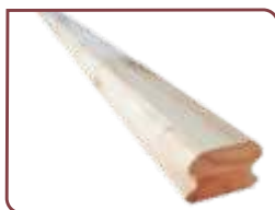
Euca Línea Natural 42 x 65 mm