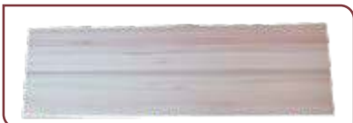
ESCALON . Euca Clear . 30 x 270 x 750/950 mm